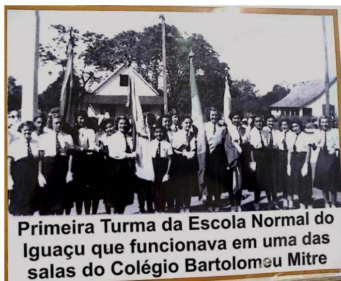
Imagem 1: Arquivo da Biblioteca do Colégio Estadual Bartolomeu Mitre